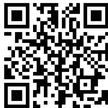
新規登録 QR コード